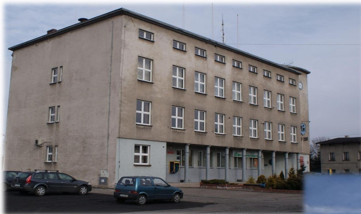
Budynek Urzędu Miejskiego w Kaletach