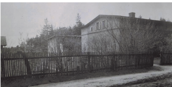
Strażnica Leśna (Wald Warter) Kolybka