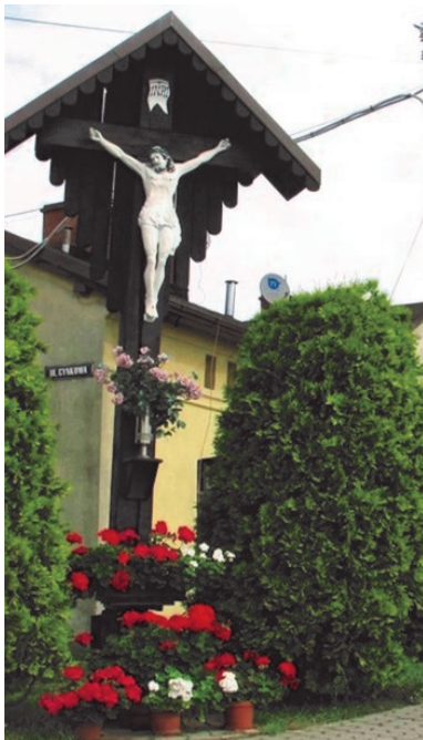
Krzyż z Kolybki