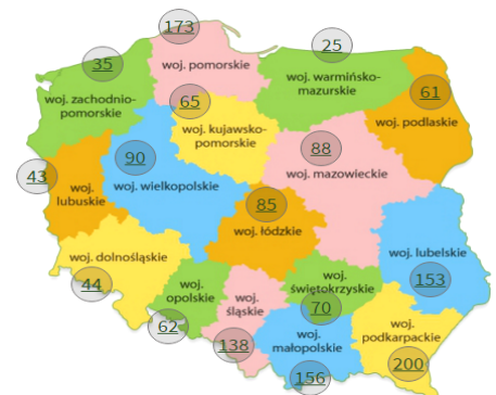
Liczby Produktów Tradycyjnych z Listy z podziałem na województwa