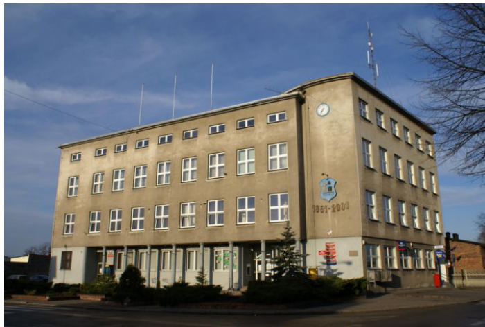
Budynek urzędu przed termomodernizacją