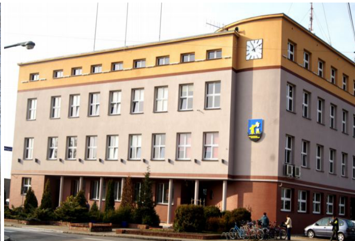
Budynek urzędu obecnie